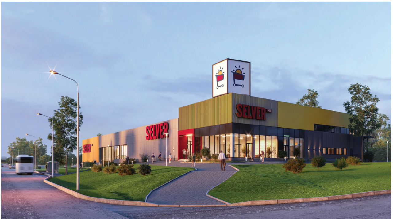
Laagri piirkonda teenindav Selver valmib 2017. aasta detsembris

EFTEN Real Estate Fund III AS viis läbi fondi tegevusajaloo kolmanda eduka avaliku aktsiaemissiooni. Aktsiaid pakuti üksnes fondi senistele aktsionäridele. Kokku 6,3 miljoni euro suurune emissioon märgiti 3,8-kordselt üle. Eduka emissiooni järel omandas fond Hortese aianduskeskuse Tallinnas, Laagris. Lisaks omandas fond Tallinnas, aadressil Pärnu mnt 554 uut Selveri kauplust rajava projektifirma täisosaluse. Uus Laagri piirkonda teenindav Selveri kauplus valmib 2017. aasta detsembris. 2017. aasta augustis lõppevad fondi suurima investeeringu, Šiauliais asuva Saules Miestase kaubanduskeskuse, fassaadi uuendustööd ning 2018. aasta esimesel poolaastal valmib DSV Riia logistikakeskuse põhjalik ümberehitus.