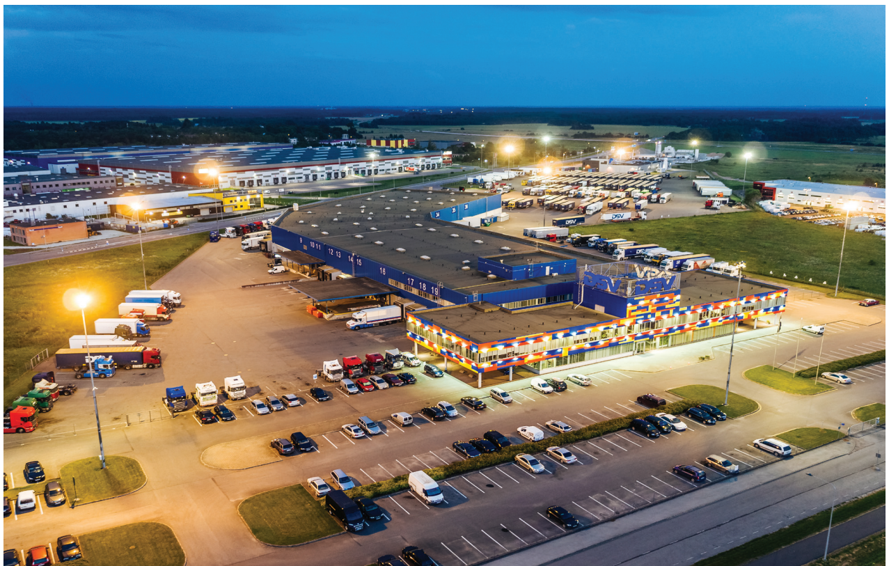
DSV logistikakeskus Tallinnas